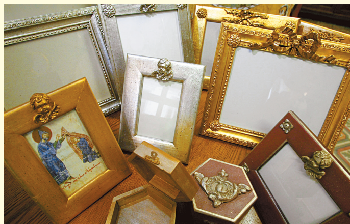
Ewa crée et restaure également des cadres et miroirs.

ATELIER , 98, rue Breteuil, Marseille Tél. : 06 85 64 08 68.